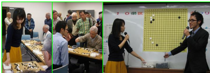
▲指導碁も人気、希望者が多数で抽選に。大盤解説も好評