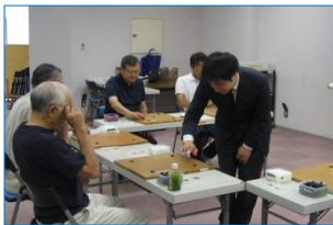
両プロ棋士による指導碁