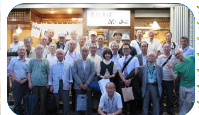
熊、兆両プロを囲んで!