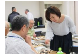
指導碁(1局、充実した80分)