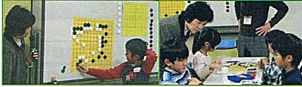
▲連碁にチャレンジ