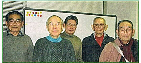
▲ Cブロックで優勝、見事連覇を果たした大船パークタウン囲碁クラブの皆さん