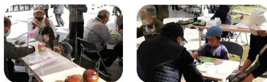
子供へ囲碁ルールを説明し対局

大船駅笠間口前の GRAND SHIP のエリアマネジメント運営委員会から依頼され11月19日(土)に開催された GRAND SHIP オータムフェスのイベントで囲碁体験コーナーを設けた。最初は参加してくれる人は少なかったが、最終的に40名の参加があった。