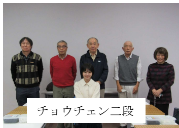
チョウチェン二段