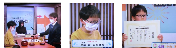
<3子局>開始 堂々の6目勝ち 七段の認定状授与

第2回,3回,4回,5回と、各インストラクターとの対局を頑張り六段に進み、最後の認定テストの相手は現役プロ棋士で好調の林漢傑八段でした。