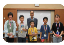
子供メダリスト A~Cクラス