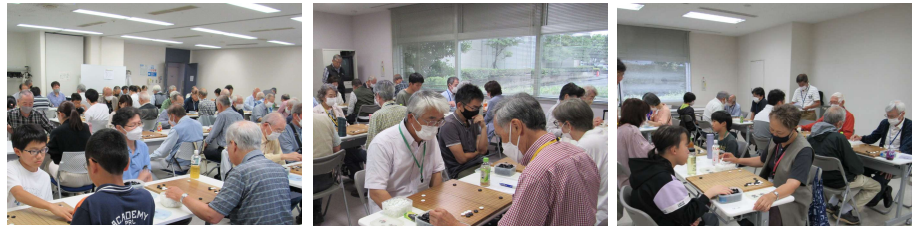
会場(左から)囲碁大会、認定会(1-5級)、同(6-18級)

33名の昇段者（大会）、23名の昇級・昇段者（認定会）が誕生し、充実した1日となった。