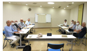
上郷チーム (左) 本郷 A チーム