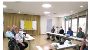
豊田チーム (左) 本郷 B チーム