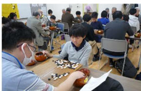
本郷日曜子供教室での対局風景