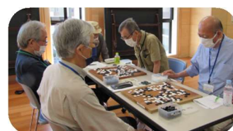
上達コース認定会