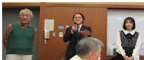
栄区専属みたいなお2人、笑顔で！