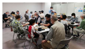
入門・初級コース 19 路盤