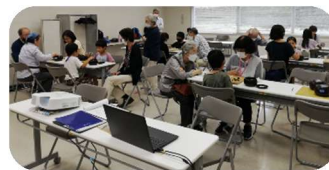
入門・初級コース 13 路盤