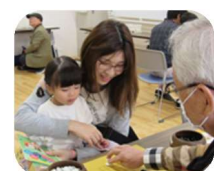
初心者に囲碁ルール説明と対局指導