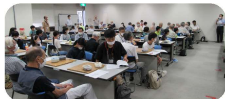
囲碁大会会場風景

毎年7月の海の日に開催されていたが、今年度から前週の13日(日曜)に開催されることになった。