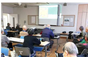
囲碁ソフト使用の講義