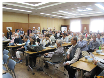
日本棋院より蘇耀国九段と辻華三段を迎え開会式

【 囲碁大会 】グループ（A～D）別優勝者（全勝）9 人と敢闘賞（高校生以下）5 人